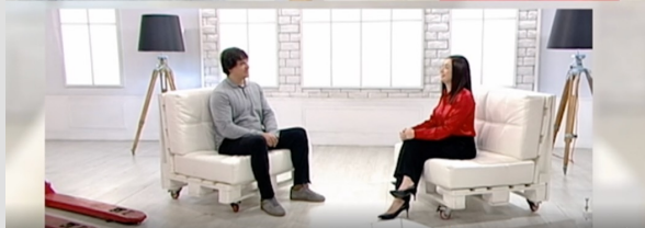
Программа «Правила жизни» на Россия-Культура