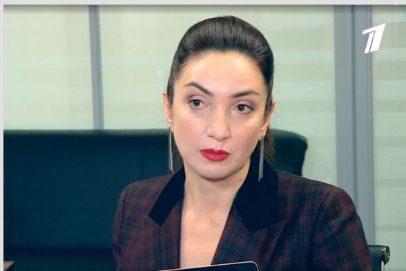
Программа «Доброе утро» на Первом канале