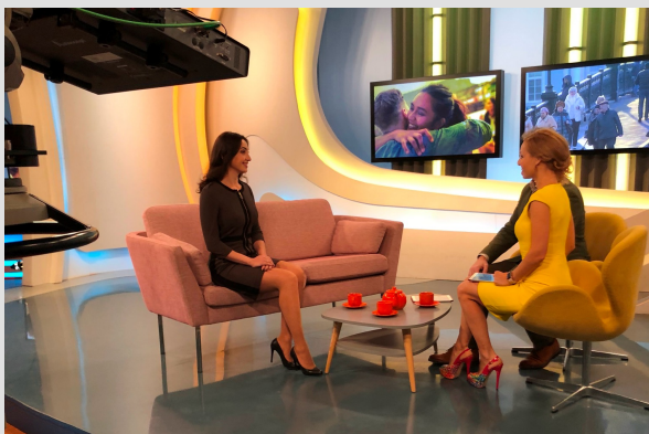
Программа «Настроение» на ТВЦ